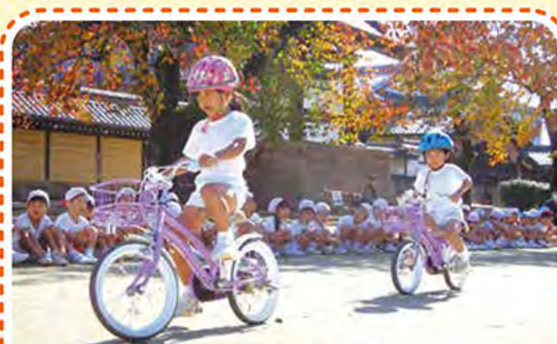
本堂前で自転車パレード