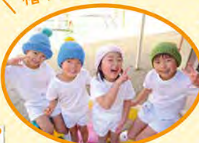
手作りの帽子だよ!